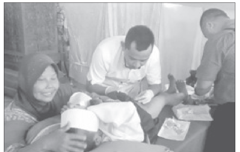
MENGHUBUR - Seorang ibu tengah menghibur anaknya yang menangis ketakutan saat mengikuti kegiatan sunatan massal.

Pada pelaksanaannya, terdengar suara riuh ramai anak-anak menangis karena takut akan disunat meskipun mereka didampingi kedua orangtuanya atau keluarga saat disunat namun banyak anak