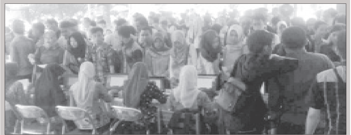
ANTUSIAS - Pengunjung Job Fair 2017 sangat antusias menanyakan lowongan kerja yang tersedia di setiap stand.

"Instruktur dan pelatih berasal dari kalangan PMI Cabang Tegal, Polres Tegal, Yon Zipur, Unit Damkar Satpol PP, Gallawi Rescue, Tagana Dinsos, Pramuka Peduli, Ubaloka daerah dan kwartir cabang," paparnya. (s@n)