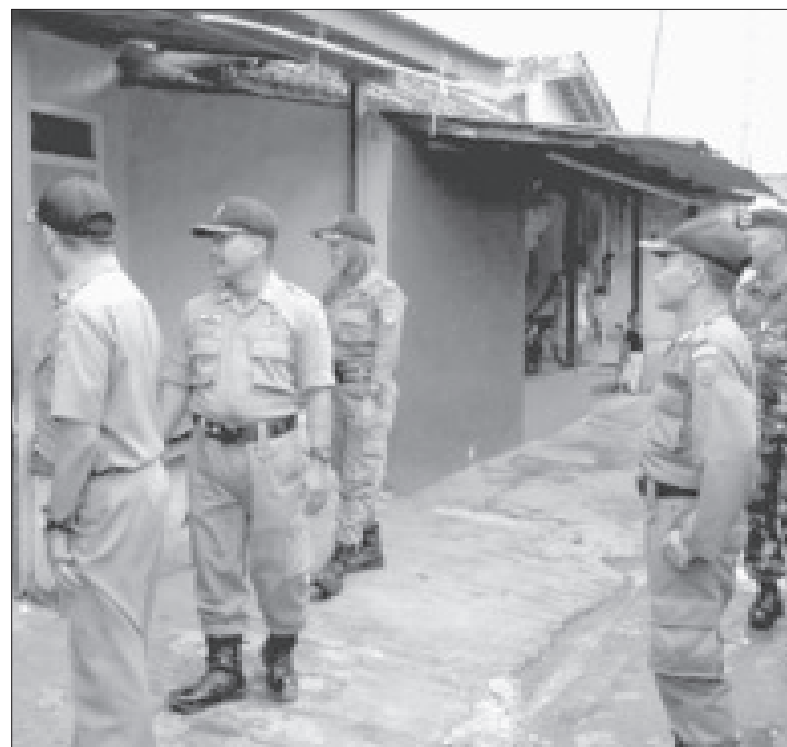
PATROLI - Petugas gabungan melakukan patroli di eks lokalisasi pantura.

pukul 17.00 dan 17.00 hingga pukul 01.00 Wib. Selain berjaga- jaga di pos pengamanan, petugas juga akan melakukan patroli keliling lokalisasi. "Kami memberikan kesempatan kepada para PSK untuk mengambil barang-barang yang masih tertinggal. Tapi, jika mereka datang kembali untuk menjajakan seks akan kami tindak tegas," tegas Kasatpol PP Kabupaten Tegal, Drs M Berlian Adji, MM. (s@n)