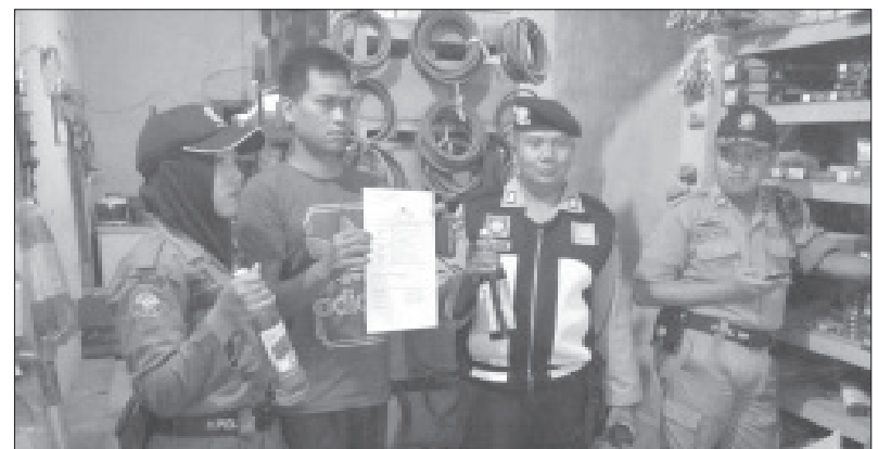
MIRAS SITAAN - Petugas memperlihatkan miras hasil operasi.

"Bila ditemukan ada oknum TNI yang terlibat maka yg berwenang menangani dari Sub Denpom IV/1-3 Tegal," terangnya.