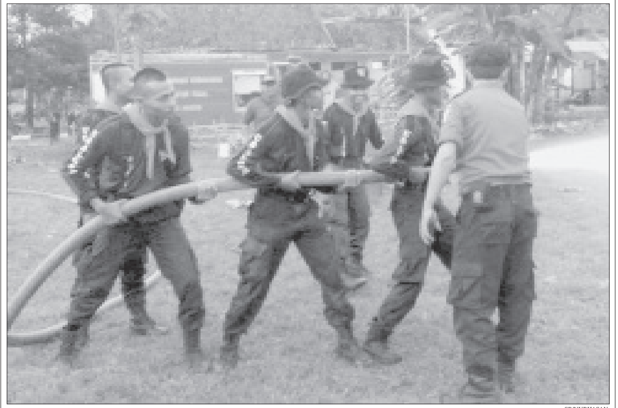
BERSEMANGAT - Sejumlah anggota Pramuka penuh semangat berlatih memadamkan api dengan peralatan pemadam kebakaran. Kegiatan tersebut merupakan Gladi Tangguh Unit Bantu Pertolongan Pramuka (Ubaloka)..