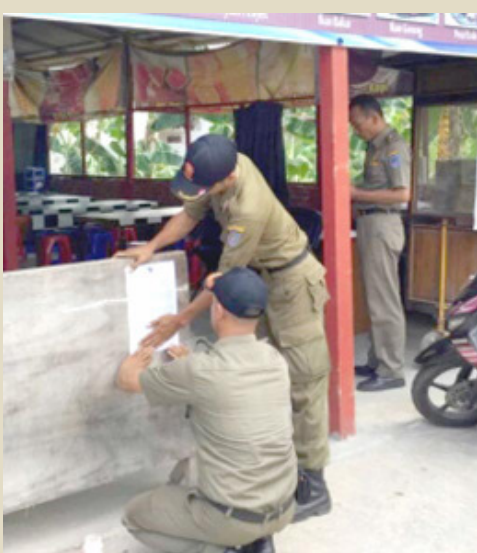
TEMPEL EDARAN - Petugas Satpol PP tengah menepelkan Edaran Bupati di salah satu rumah makan..