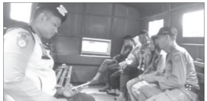
DIANGKUT - Petugas mengangkut pasangan tidak resmi dari sejumlah penginapan.

"Kementerian Sosial mencatat, penutupan lokalisasi di Tegal ini merupakan yang ke 115 dari 168 lokalisasi yang ada di seluruh Indonesia. Kementerian Sosial juga akan mendukung sepenuhnya pemerintah kabupaten dan kota di Indonesia yang akan menutup tempat pelacuran. Targetnya, Indonesia bebas Prostitusi pada tahun 2019 mendatang," ujar Sonny saat mewakili Menteri Sosial,